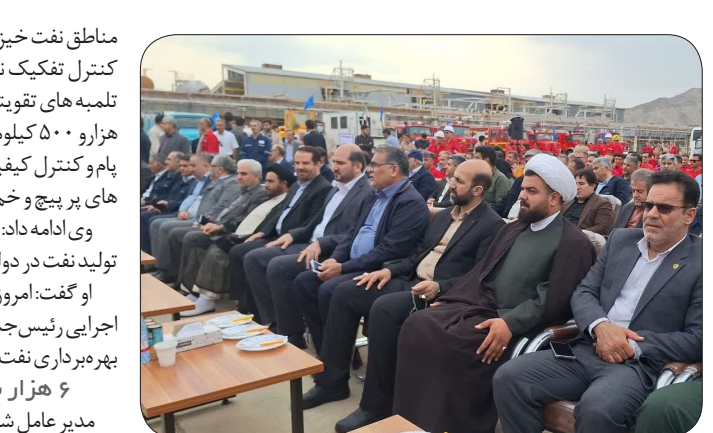
استاندار کهگیلویه و بویراحمد گفت: تولید نفت در این منطقه نفت خیز با ۸۰ هزار بشکه افزایش ظرف یک سال گذشته هم اینک به ۶۳۰ هزار بشکه در روز رسیده است